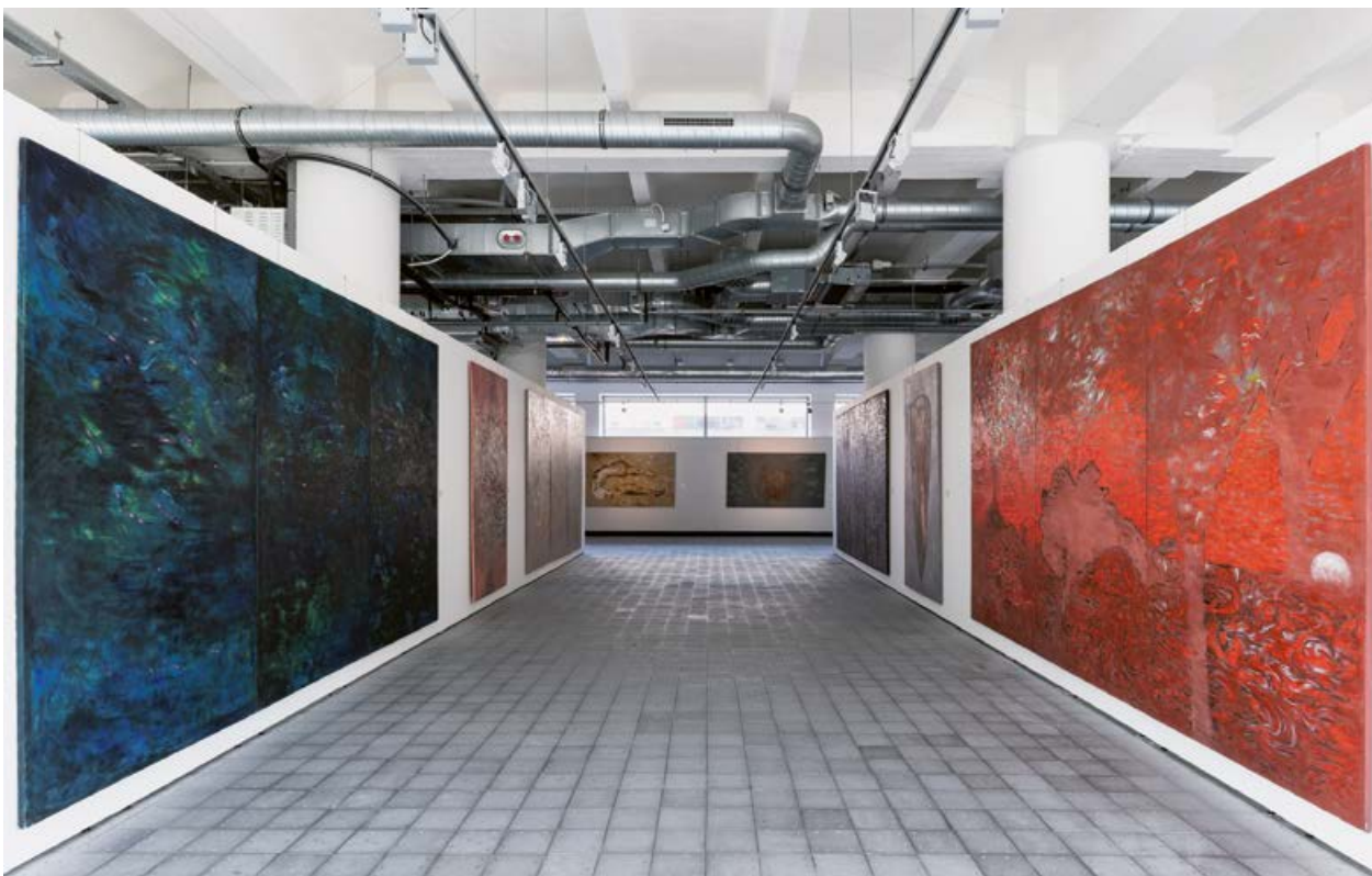
Pohled do výstavy Václav Vaculovič Naléhavost času , Krajská galerie výtvarného umění ve Zlíně, 2022, v popředí zleva: Dramatická krajina , 2020, olej, plátno, 250×420 cm; Ranní ostrovy 2011, olej, plátno, 250×420 c

Tento text vzniká u příležitosti výstavy Václava Vaculoviče (Olomouc, 1957) v Krajské galerii výtvarného umění ve Zlíně. Autor usedlý dlouhá léta v Kroměříži patřil zejména v devadesátých letech k poměrně frekventovaným umělcům na kolektivních přehlídkách s velkým počtem samostatných výstav. Od roku 1990 a dodnes se věnuje organizování Mezinárodního festivalu současného umění