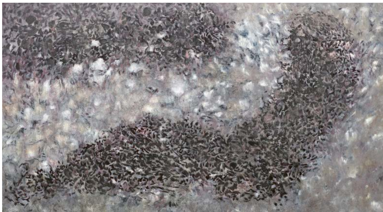
Václav Vaculovič, Zmrtvýchvstání, 2017, olej, plátno, 140×250 cm