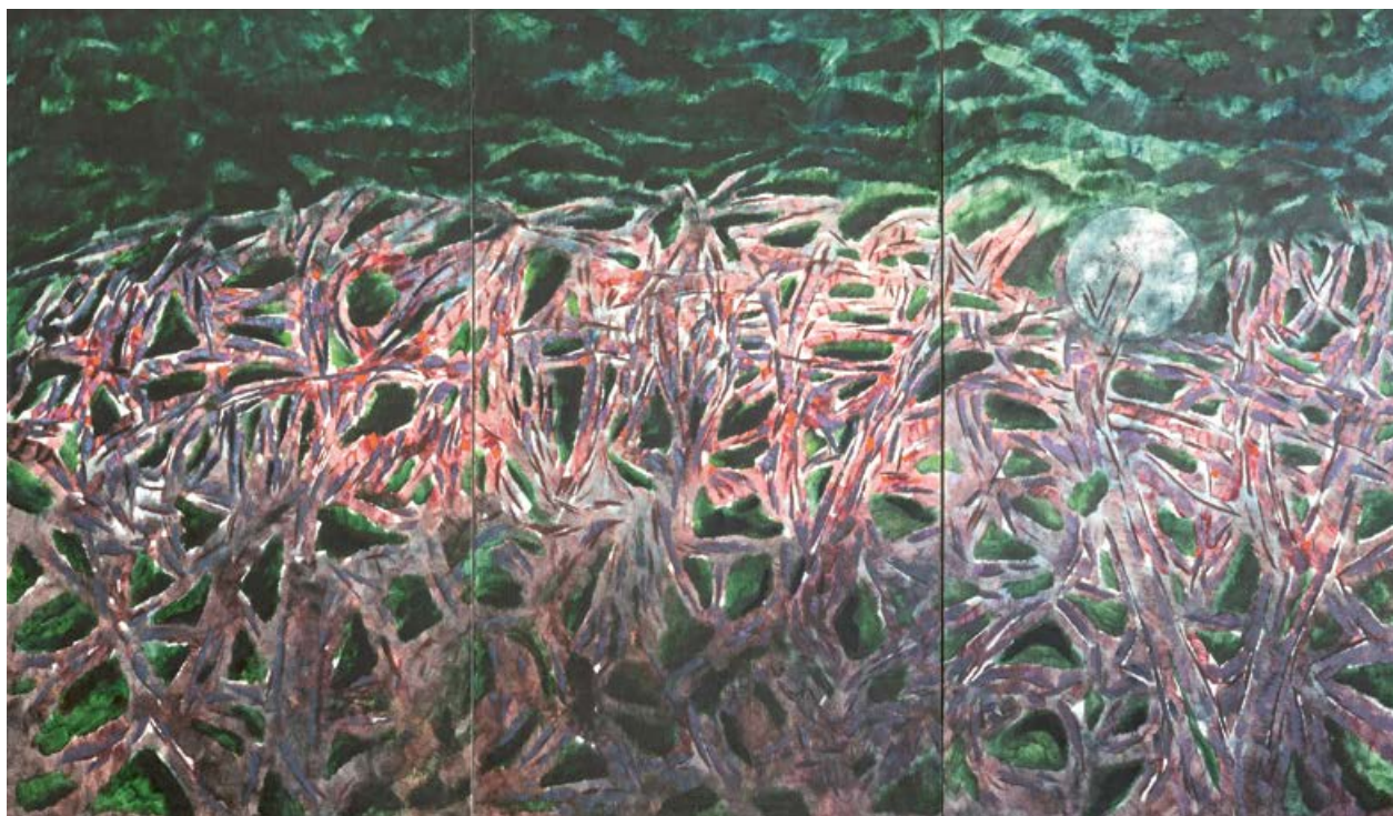
Václav Vaculovič, S mrtvými jazykem mrtvých, 2018, olej, plátno, 250×420 cm