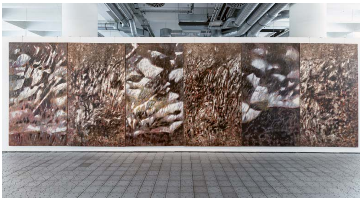
Pohled do výstavy Václav Vaculovič Naléhavost času, Krajská galerie výtvarného umění ve Zlině, 2022, Průrvy nad zemí, 2009, olej, plátno, 250×840 cm

V osmdesátých letech vytvořil Václav Vaculovič řadu kreseb a monotypů, jejichž častým námětem je lidské tělo v různých postojích nebo zobrazeno z různých i neobvyklých úhlů. Modelem mu stála nejčastěji jeho manželka. Možná právě soustavná práce s jedním modelem autorovi umožnila odhlížet od individuálních, smyslových rysů postavy a postihnout esenci člověka jako jednoty těla a ducha. Stěží lze proto v tomto ohledu hovořit o tělesnosti, neboť ta často evokuje pouhou materialitu. Zde však jde o těla naplněná životem a emocemi. Pokud bychom měli hovořit o ústředním tématu,