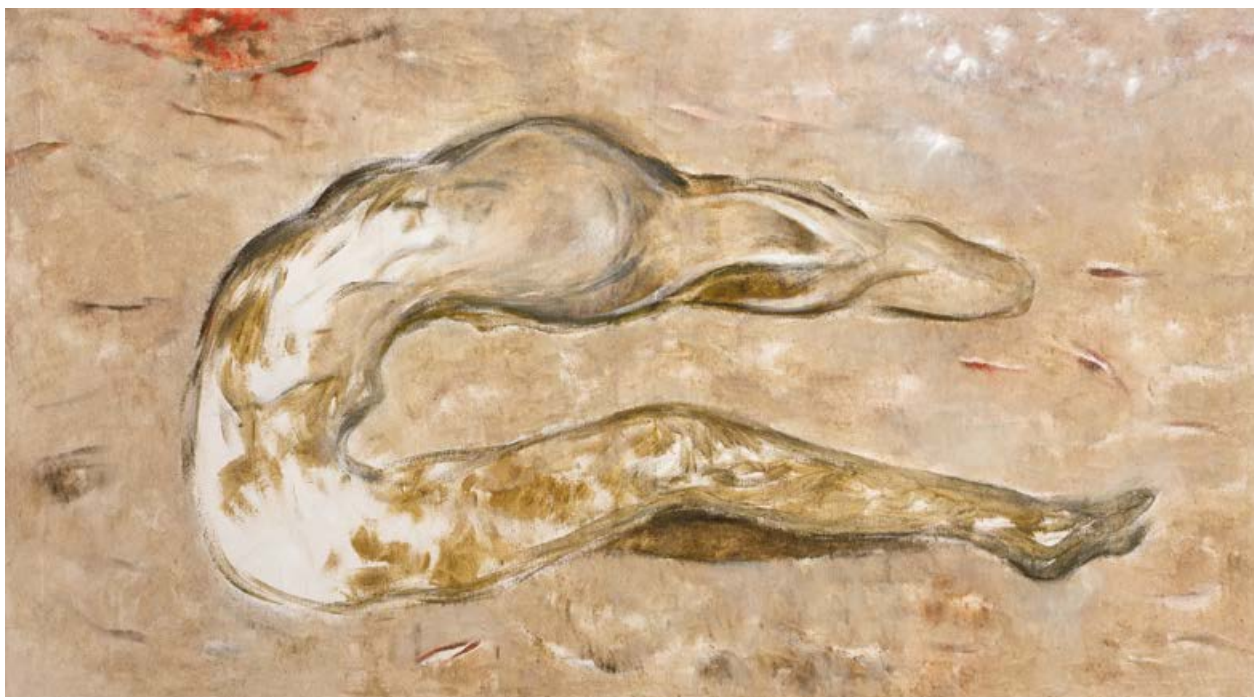
Václav Vaculovič, Palčivý oblouk, 2010, olej, plátno, 140×250 cm