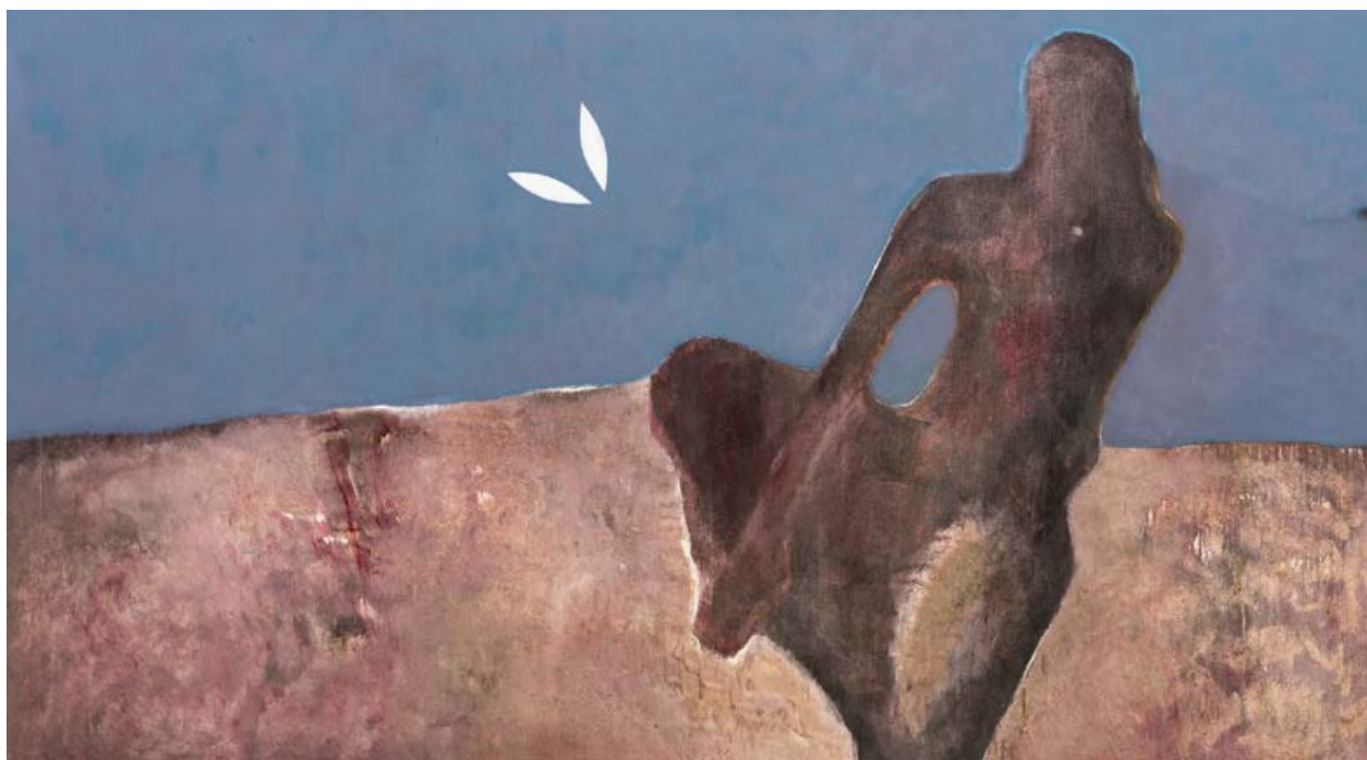
Václav Vaculovič, Vím, že chceš mou duši, 2010, olej, plátno, 140×250 cm

Forfest Czech Republic, který se v podtitulu odkazuje na „umění s duchovním zaměřením“. Touto duchovností, jak plyne z programu i zúčastněných autorů a interpretů, není míněn přímý odkaz na konkrétní duchovní nauku nebo náboženský systém. Je jím míněno umění, které vyvěrá z duše. Duchovní odezvy našeho nejvlastnějšího bytí, které v sobě má, byť v třeba jen v latentní a potlačené podobě, každý člověk. Je to umění, které se obrací k člověku, a zároveň reflektuje lidskou zkušenost. I když mnoho